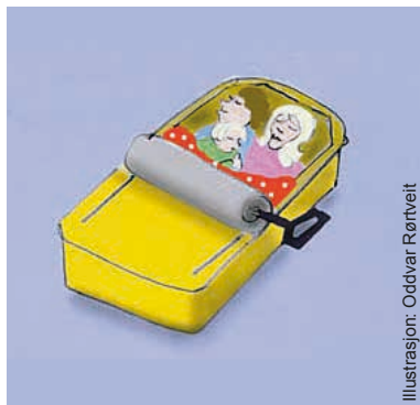
Illustrasjon: Oddvar Rørtveit