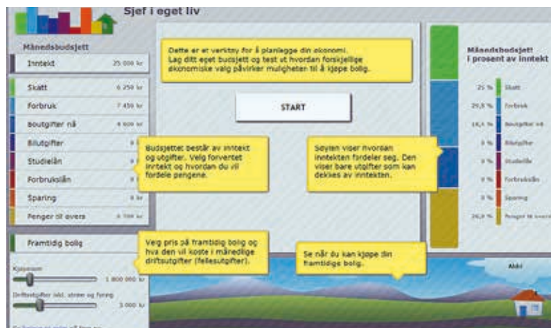
Slik ser skjermbildet av simulatoren ut.

Se https://sjefiegetliv.husbanken.no/ Sjef i eget liv -simulatorens har også egen Facebookside: https://nb-no.facebook.com/husbanken/posts/479209785430074